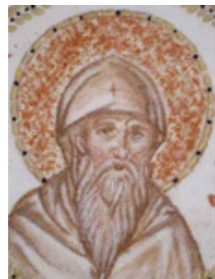
Άγιος Διονύσιος ο εν Ολύμπω