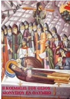
Άγιος Διονύσιος ο εν Ολύμπω