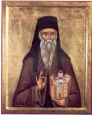
Άγιος Διονύσιος ο εν Ολύμπω