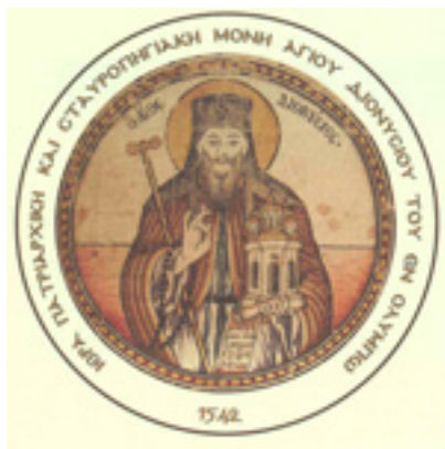
Άγιος Διονύσιος ο εν Ολύμπω