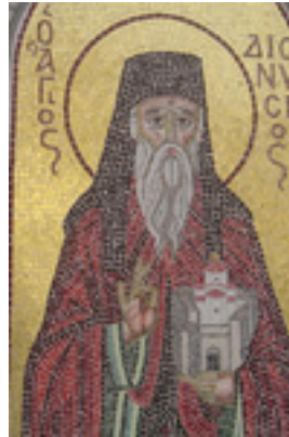
Άγιος Διονύσιος ο εν Ολύμπω