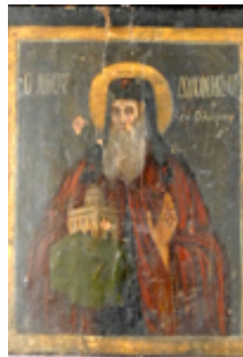
Άγιος Διονύσιος ο εν Ολύμπω - 1884 μ.Χ. - Ι.Ν. Ζωοδόχου Πηγής, Λαρίσης ( http://www.panagialarisis.gr )