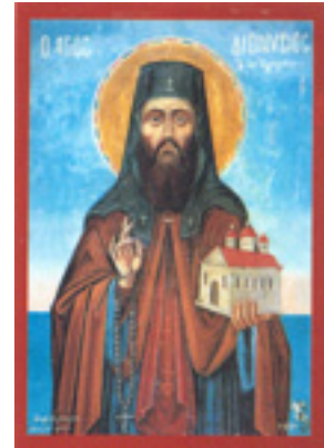
Άγιος Διονύσιος ο εν Ολύμπω