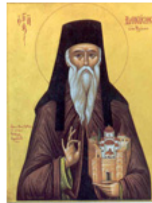
Άγιος Διονύσιος ο εν Ολύμπω