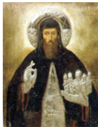
Άγιος Διονύσιος ο εν Ολύμπω