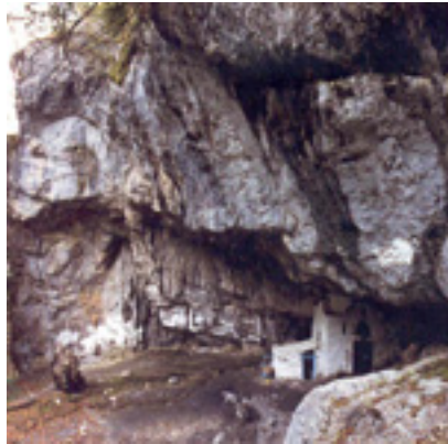
Το Άγιο Σπήλαιο