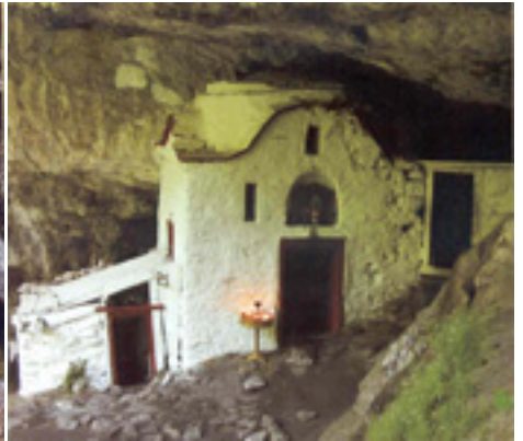
Το Άγιο Σπήλαιο