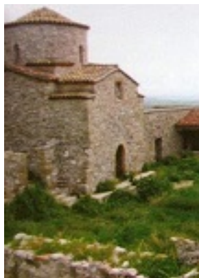
Παναγία η Τοχνιώτισσα