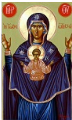
Παναγία η Τοχνιώτισσα - Μιχαήλ Χατζημιχαήλ