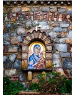
Σύναξη της Παναγιάς της Γοργοεπηκούου στην Μάνδρα Αττικής