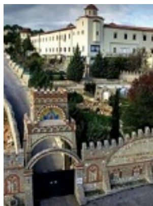
Σύναξη της Παναγιάς της Γοργοεπηκούου στην Μάνδρα Αττικής