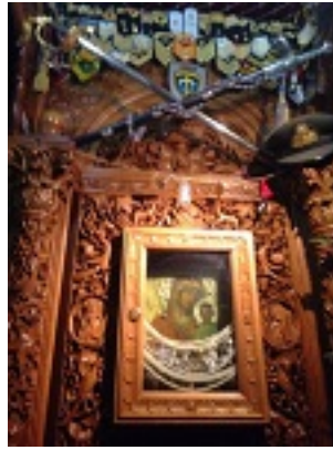
Σύναξη της Παναγιάς της Γοργοεπηκούου στην Μάνδρα Αττικής