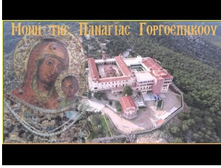
Παναγία η Γοργοεπήκοος (Μάνδρα Αττικής) (HD)