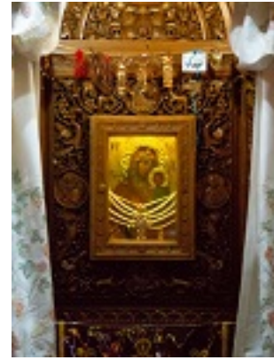
Σύναξη της Παναγιάς της Γοργοεπηκούου στην Μάνδρα Αττικής