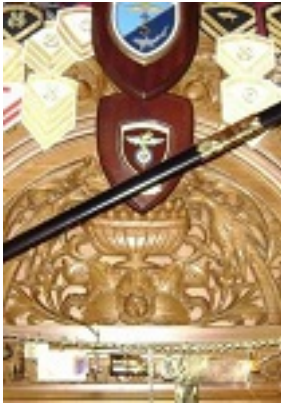
Σύναξη της Παναγιάς της Γοργοεπηκούου στην Μάνδρα Αττικής