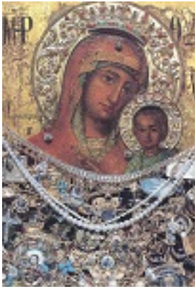
Σύναξη της Παναγιάς της Γοργοεπηκούου στην Μάνδρα Αττικής