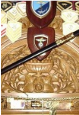
Σύναξη της Παναγιάς της Γοργοεπηκούου στην Μάνδρα Αττικής