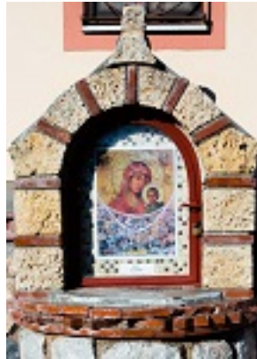
Σύναξη της Παναγιάς της Γοργοεπηκούου στην Μάνδρα Αττικής