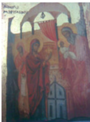
Παναγία η Μαρουλιανή