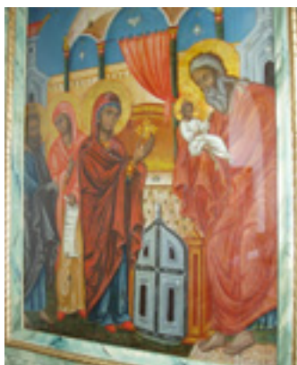
Παναγία η Μαρουλιανή