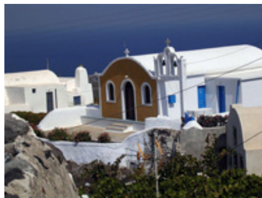
Η Παναγία η Μαρουλιανή στην Οία της Σαντορίνης