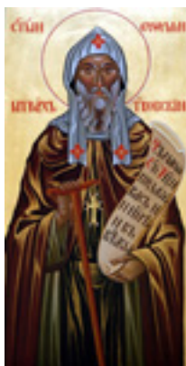
Άγιος Ευθύμιος Αρχιεπίσκοπος Τυρνόβου