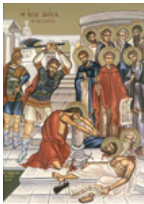
Άγιοι Δέκα Μάρτυρες μαρτύρησαν στην Κρήτη