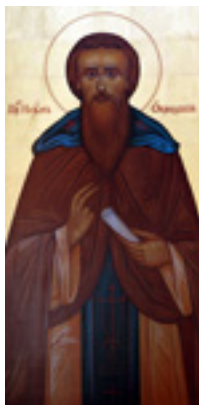
Άγιος Ναούμ ο Θεοφόρος και θαυματουργός