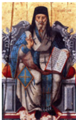
Άγιος Διονύσιος ο Νέος, ο Ζακυνθινός Αρχιεπίσκοπος Αιγίνης. Φορητή εικόνα στο Ναό Αγίου Νικολάου στην Εξωχώρα Ζακύνθου, έργο ιερέως Πέτρου Βόσσου, 1786 μ.Χ.