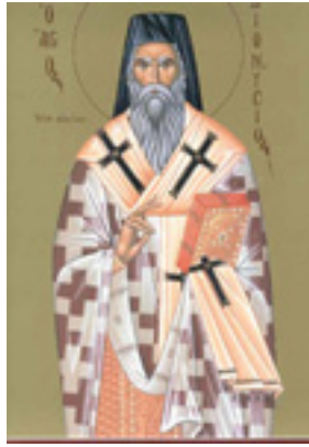
Άγιος Διονύσιος ο Νέος, ο Ζακυνθινός Αρχιεπίσκοπος Αιγίνης