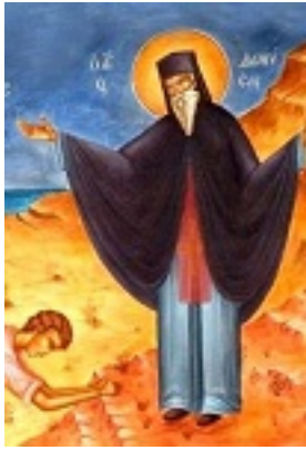
Άγιος Διονύσιος ο Νέος, ο Ζακυνθινός Αρχιεπίσκοπος Αιγίνης - Η συγχώρησις του φονέως