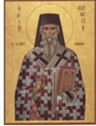
Άγιος Διονύσιος ο Νέος, ο Ζακυνθινός Αρχιεπίσκοπος Αιγίνης