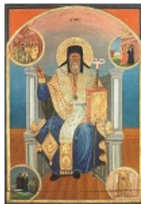
Άγιος Διονύσιος ο Νέος, ο Ζακυνθινός Αρχιεπίσκοπος Αιγίνης