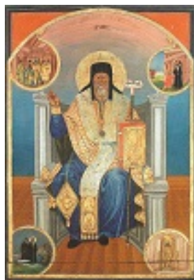
Άγιος Διονύσιος ο Νέος, ο Ζακυνθινός Αρχιεπίσκοπος Αιγίνης