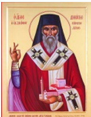
Άγιος Διονύσιος ο Νέος, ο Ζακυνθινός Αρχιεπίσκοπος Αιγίνης