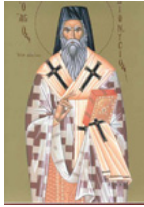
Άγιος Διονύσιος ο Νέος, ο Ζακυνθινός Αρχιεπίσκοπος Αιγίνης