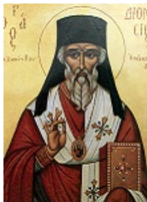
Άγιος Διονύσιος ο Νέος, ο Ζακυνθινός Αρχιεπίσκοπος Αιγίνης