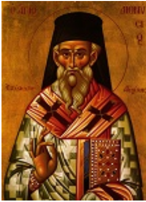
Άγιος Διονύσιος ο Νέος, ο Ζακυνθινός Αρχιεπίσκοπος Αιγίνης