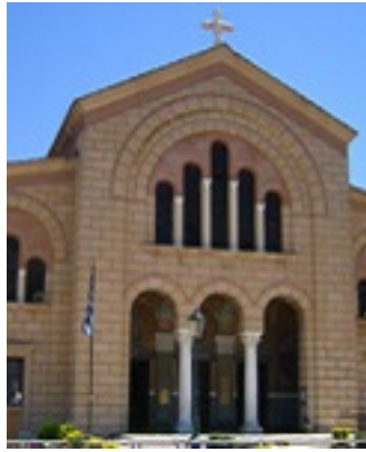
Ο Ναός του Αγίου Διονυσίου στη Ζάκυνθο