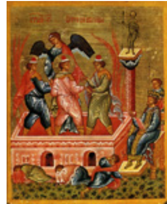
Άγιοι Τρεις Παίδες