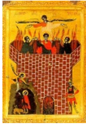
Οι Άγιοι Τρεις Παίδες μέσα στο καμίνι και ο Προφήτης Δανιήλ στον λάκκο των λεόντων (Δαν. κεφ. 3 και 6) - 18ος αι. μ.Χ. - Πρωτάτο, Άγιον Όρος