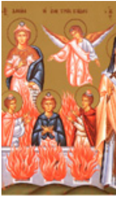
Ο Προφήτης Δανιήλ και οι Άγιοι Τρεις Παίδες