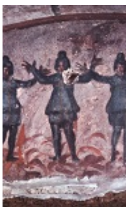
Οι Τρεις Παίδες εν Καμίνω, τοιχογραφία από την Κατακόμβη της Πρισίλλας στη Ρώμη, μέσα 3ου αι. μ.Χ.