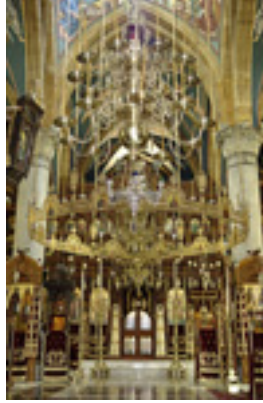
Αποψη του Καθολικού<br />της Μονής Μαχαιρά