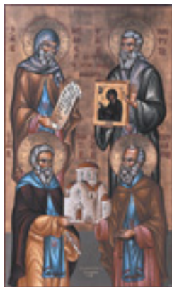
Οι κτίτορες της Μονής Μαχαιρά<br />Οσοι Νεόφυτος, Ιγνάτιος,<br />Προκόπιος και Νείλος