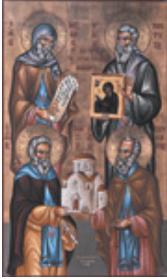
Οι κτίτορες της Μονής Μαχαιρά<br />Οσοι Νεόφυτος, Ιγνάτιος,<br />Προκόπιος και Νείλος