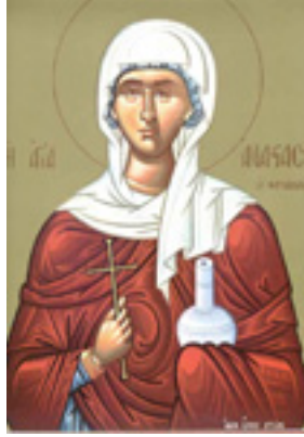
Αγία Αναστασία η Φαρμακολύτρια