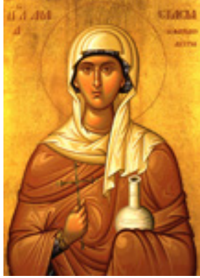
Αγία Αναστασία η Φαρμακολύτρια