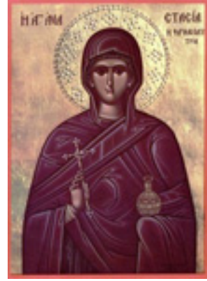
Αγία Αναστασία η Φαρμακολύτρια