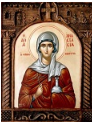
Αγία Αναστασία η Φαρμακολύτρια - Βασίλειος & Περικλής Συρίμης© (sirimis.gr)