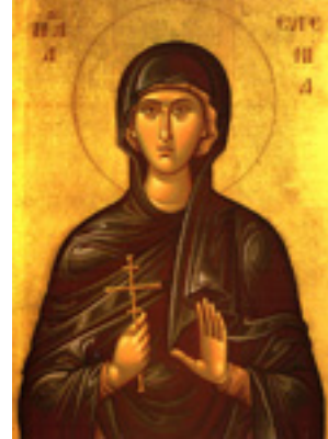
Αγία Ευγενία η Οσιοπαρθενομάρτυς Αγία Ευγενία η Οσιοπαρθενομάρτυς Αγία Ευγενία η Οσιοπαρθενομάρτυς