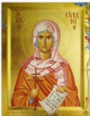
Αγία Ευγενία η Οσιοπαρθενομάρτυς - Γεωργία Δαμκούκα© ( http://www.tempera.gr )