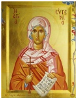
Αγία Ευγενία η Οσιοπαρθενομάρτυς - Γεωργία Δαμκούκα© ( http://www.tempera.gr )