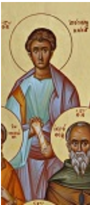
Άγιος Κάισαρ Απόστολος εκ των Εβδομήκοντα