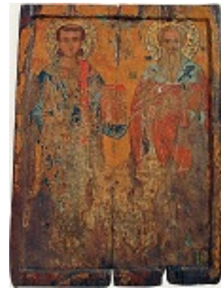
Εικόνα Αγίου Στεφάνου και Αγίου Τυχικού, 14ος αιώνας μ.Χ.