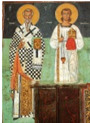
Οι Άγιοι Τυχικός και Στέφανος