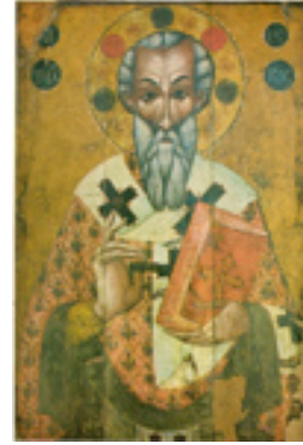
Άγιος Τυχικός ο Απόστολος