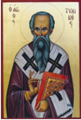
Άγιος Τυχικός ο Απόστολος