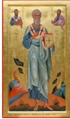
Άγιος Τυχικός ο Απόστολος