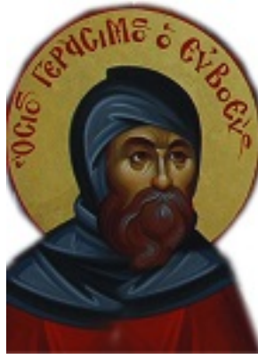
Όσιος Γεράσιμος ο εξ Ευρίπου