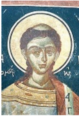
Άγιος Στέφανος ο Πρωτομάρτυρας