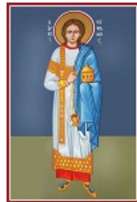
Άγιος Στέφανος ο Πρωτομάρτυρας - Καζακίδου Μαρία© (byzantineartkazakidou. blogspot.com)