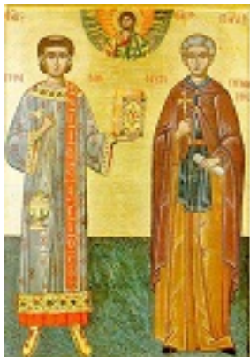
Άγιοι Στέφανος και Παύλος ο Ξηροποταμινός - μέσα του 18 αι. μ.Χ., Νέα Σκήτη Άγιον Όρος