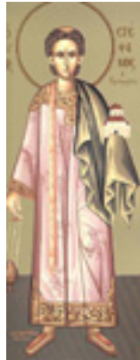
Άγιος Στέφανος ο Πρωτομάρτυρας