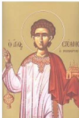
Άγιος Στέφανος ο Πρωτομάρτυρας