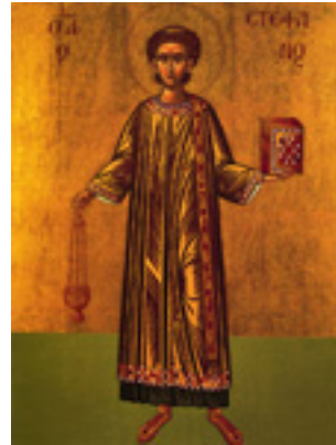
Άγιος Στέφανος ο Πρωτομάρτυρας