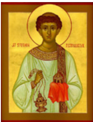
Άγιος Στέφανος ο Πρωτομάρτυρας