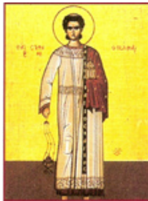
Άγιος Στέφανος ο Πρωτομάρτυρας