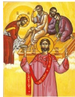
Άγιος Στέφανος ο Πρωτομάρτυρας