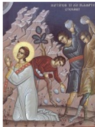
Άγιος Στέφανος ο Πρωτομάρτυρας