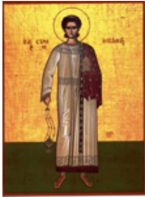
Άγιος Στέφανος ο Πρωτομάρτυρας