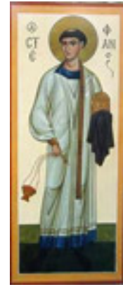
Άγιος Στέφανος ο Πρωτομάρτυρας