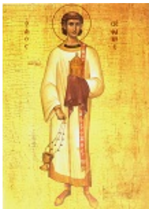
Άγιος Στέφανος ο Πρωτομάρτυρας