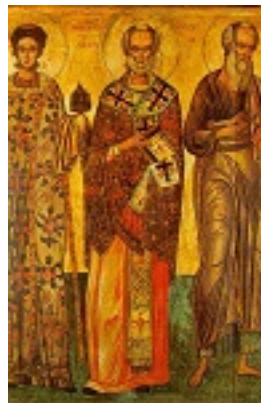
Άγιος Στέφανος, Νικόλαος, Ιωάννης ο Θεολόγος - 16ος και 18ος αι. μ.Χ. - Πρωτάτο, Άγιον Όρος