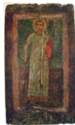
Άγιος Στέφανος ο Πρωτομάρτυρας - Απεικόνιση του βου αιώνα μ.Χ.