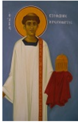
Άγιος Στέφανος ο Πρωτομάρτυρας - I. N. Οσίων Παρθενίου και Ευμενίου των εν Κουδουμά, δια χειρός Παναγιώτη Μόσχου (2006 μ.Χ.)