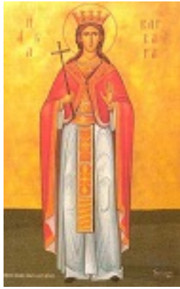
Αγία Βαρβάρα - (Γ. Παπασταματίου, 1976 μ.Χ.)