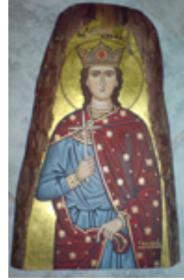
Αγία Βαρβάρα