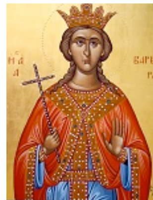
Αγία Βαρβάρα - Δωροθέα Γιαννούκου© (users.uoa.gr/~ananton/dorothea/in dex.html)