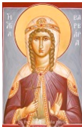
Αγία Βαρβάρα - Julia Hayes© (www.ikonographics.net)