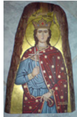
Αγία Βαρβάρα - www.zografiki.com©