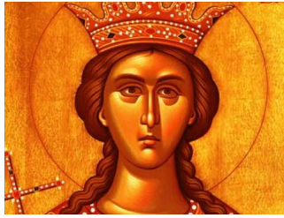
Ακούστε το απολυτίκιο!