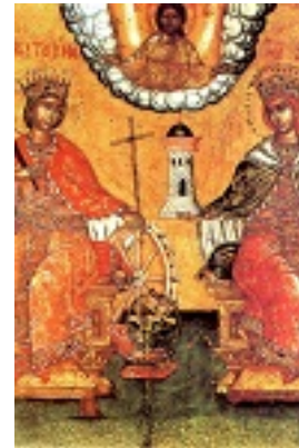
Η Αγία Αικατερίνη μαζί με την Αγία Βαρβάρα