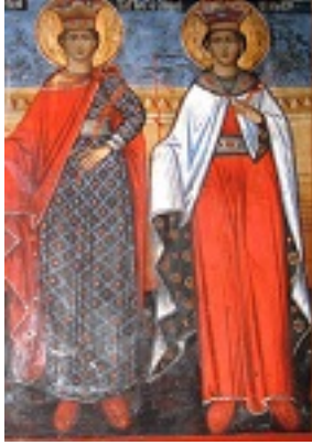
Η Αγία Βαρβάρα και η Αγία Κυριακή (Τοιχογραφία στη Λιθιά Καστοριάς, έτ. 1850 μ.Χ.)