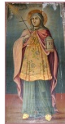
Αγία Βαρβάρα - Βασιλειάδα Καστοριάς, περί 1888 μ.Χ.