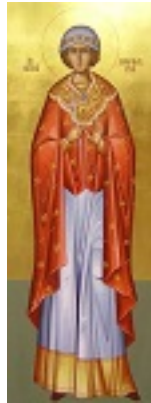
Αγία Βαρβάρα - Κωσταντίνος Τάμπης© (www.icontampis.gr)