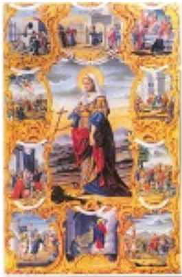
Αγία Βαρβάρα (Καρτ-ποστάλ, έργο του Α. Βεβελάκη, 1894 μ.Χ.)