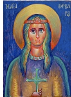
Αγία Βαρβάρα - π. Σταμάτης Σκλήρης© (stamatis-skliris.gr)