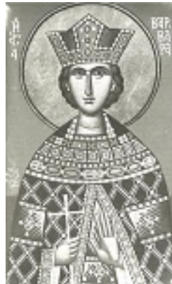
Αγία Βαρβάρα - Φώτης Κόντογλου