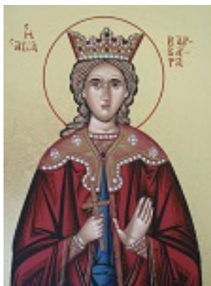
Αγία Βαρβάρα - Απόστολος Αργυρίου© (argyriou.wix.com/apostolos#!)