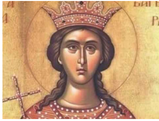
Ακούστε το απολυτίκιο!