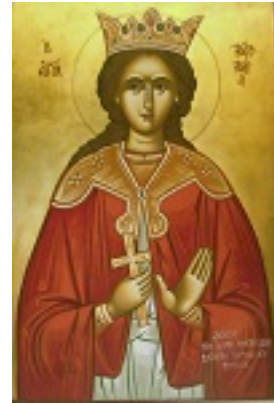
Αγία Βαρβάρα - Χρυσά Μεγαπανου© (hollyicons.blogspot.gr)