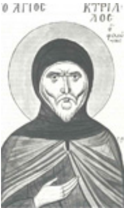
Όσιος Κύριλλος<br />ο Φιλεώτης