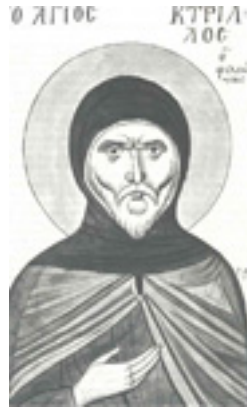
Όσιος Κύριλλος<br />ο Φιλεώτης