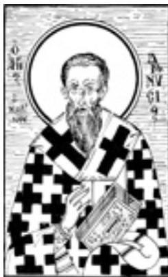
Άγιος Διονύσιος επίσκοπος Κορίνθου