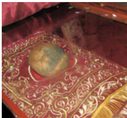
Άγιος Φιλούμενος ο Νεοιερομάρτυρας