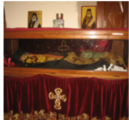
Άγιος Φιλούμενος ο Νεοιερομάρτυρας