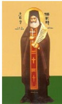
Άγιος Φιλούμενος ο Νεοιερομάρτυρας