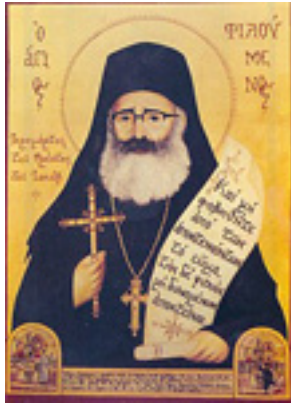
Άγιος Φιλούμενος ο Νεοιερομάρτυρας