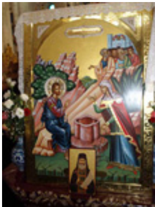
Άγιος Φιλούμενος ο Νεοιερομάρτυρας