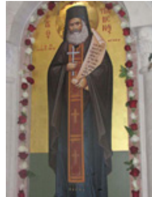
Άγιος Φιλούμενος ο Νεοιερομάρτυρας