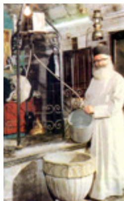
Άγιος Φιλούμενος ο Νεοιερομάρτυρας