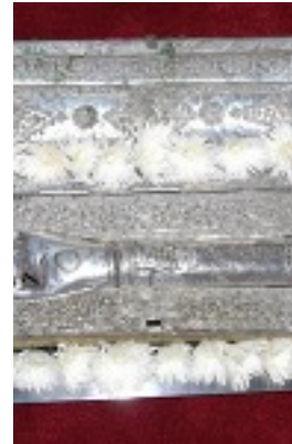
Η χείρ του Αγίου Ιερομάρτυρος Πέτρου του Πρεσβυτέρου ενός εκ των πεντεκαίδεκα Ιερομαρτύρων