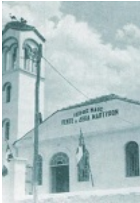
Ο παλιός Ναός των Πεντεκαίδεκα Ιερομαρτύρων πολιούχων Κιλκίς