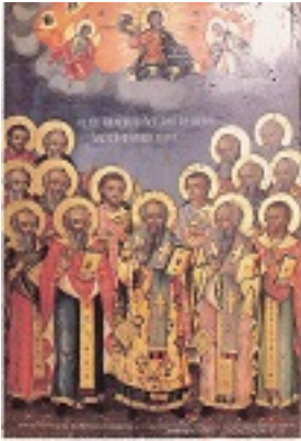
Άγιοι Πεντεκαίδεκα Ιερομάρτυρες