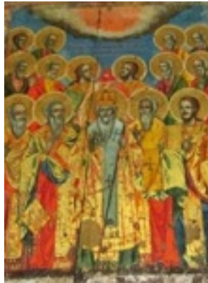
Άγιοι Πεντεκαίδεκα Ιερομάρτυρες