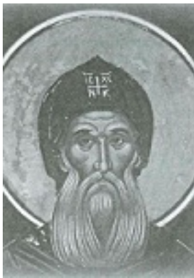
Όσιος Αθανάσιος κτήτωρ Μονής Μετεώρου