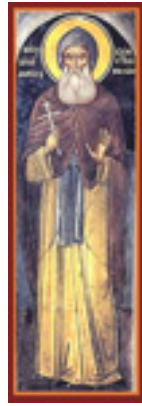
Όσιος Αθανάσιος κτήτωρ Μονής Μετεώρου