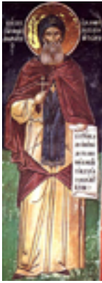
Όσιος Αθανάσιος κτήτωρ Μονής Μετεώρου