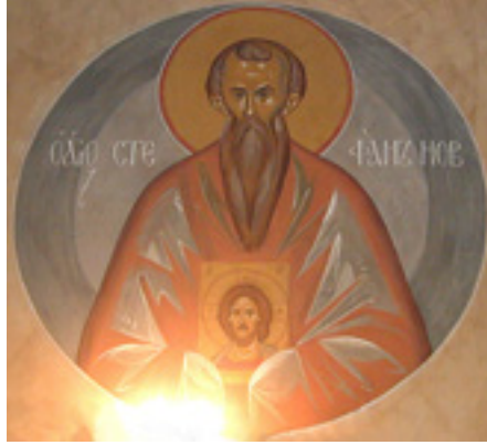
Όσιος Στέφανος Ομολογητής, ο Νέος