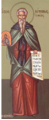
Όσιος Στέφανος Ομολογητής, ο Νέος