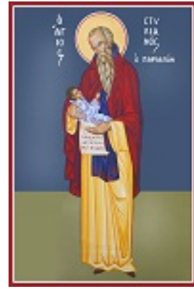
Όσιος Στυλιανός ο Παφλαγόνας - Καζακίδου Μαρία© (byzantineartkazakidou. blogspot.com)