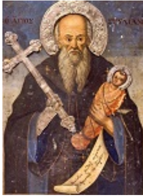
Όσιος Στυλιανός ο Παφλαγόνας