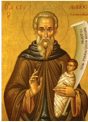
Όσιος Στυλιανός ο Παφλαγόνας