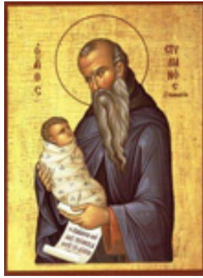
Όσιος Στυλιανός ο Παφλαγόνας