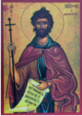
Ἵσιος Νίκων ὁ «Μετανοεῖτε»