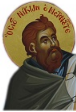
Ἵσιος Νίκων ὁ «Μετανοεῖτε»