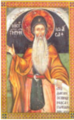
Όσιος Ιωάσαφ ο Μετεωρίτης