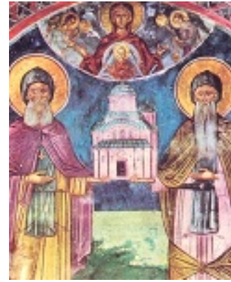
Όσιος Αθανάσιος και Όσιος Ιωάσαφ