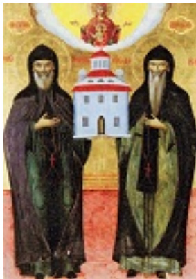
Όσιος Αθανάσιος και Όσιος Ιωάσαφ