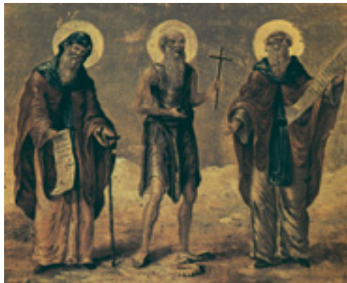
Όσιος Ιωάσαφ ο Μετεωρίτης