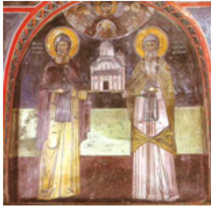
Οι κτίτορες της Ιεράς Μονής Μεγάλου Μετεώρου, Μετέωρα, όσιος Αθανάσιος και όσιος Ιωάσαφ. Τοιχογραφία στο νάρθηκα του καθολικού.