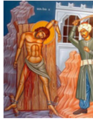
Άγιος Γεώργιος ο Νεομάρτυρας από τη Χίο