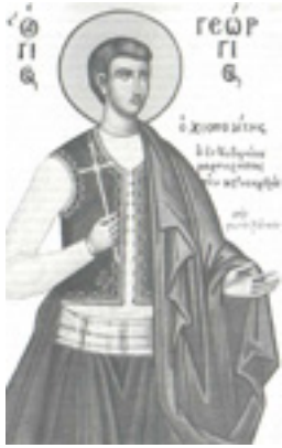
Άγιος Γεώργιος ο Νεομάρτυρας από τη Χίο