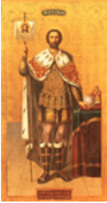
Άγιος Αλέξανδρος «Νιέφσκι»