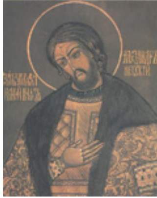
Άγιος Αλέξανδρος «Νιέφσκι»