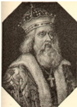
Άγιος Αλέξανδρος «Νιέφσκι»