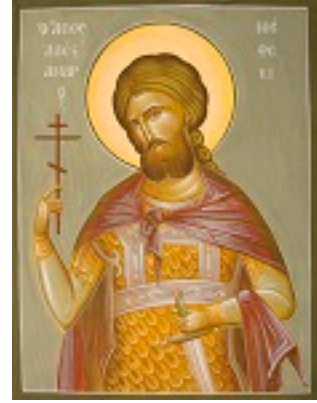
Άγιος Αλέξανδρος «Νιέφσκι» - Julia Hayes© (www.ikonographics.net)