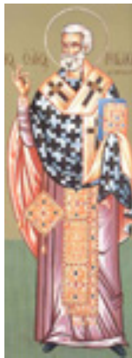
Άγιος Γρηγόριος επίσκοπος Ακραγαντίων