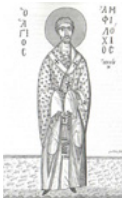
Άγιος Αμφιλόχιος Επίσκοπος Ικονίου