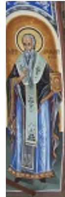
Άγιος Αμφιλόχιος Επίσκοπος Ικονίου Άγιος Αμφιλόχιος Επίσκοπος Ικονίου Άγιος Αμφιλόχιος Επίσκοπος Ικονίου - Άγιον Όρος, Μεγίστη Λαύρα