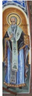
Άγιος Αμφιλόχιος Επίσκοπος Ικονίου Άγιος Αμφιλόχιος Επίσκοπος Ικονίου Άγιος Αμφιλόχιος Επίσκοπος Ικονίου - Άγιον Όρος, Μεγίστη Λαύρα