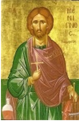
Άγιος Μένιγνος ο κναφέας