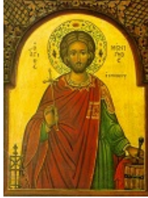
Άγιος Μένιγνος ο κναφέας