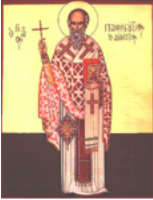
Άγιος Παφνούτιος ο Ιεροσολυμήτης, Ιερομάρτυρας