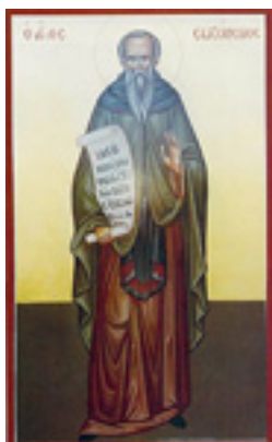
Άγιος Σωζόμενος ο θαυματουργός