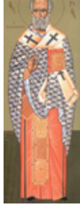
Άγιος Γρηγόριος Νεοκαισαρείας ο Θαυματουργός