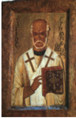
Άγιος Γρηγόριος Νεοκαισαρείας ο Θαυματουργός