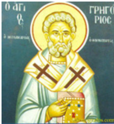
Άγιος Γρηγόριος Νεοκαισαρείας ο Θαυματουργός