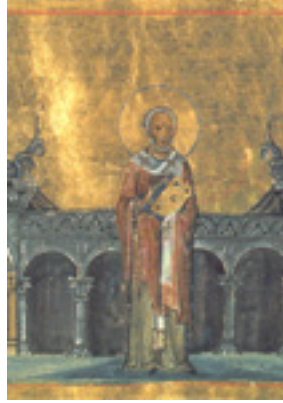
Άγιος Γρηγόριος Νεοκαισαρείας ο Θαυματουργός - Μικρογραφία από το Μηνολόγιο του αυτοκράτορα Βασιλείου του Β΄