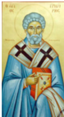
Άγιος Γρηγόριος Νεοκαισαρείας ο Θαυματουργός