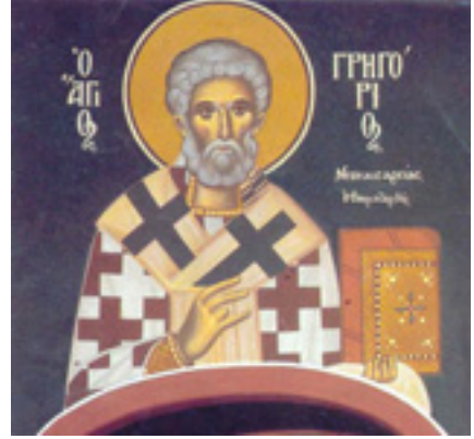
Άγιος Γρηγόριος Νεοκαισαρείας ο Θαυματουργός