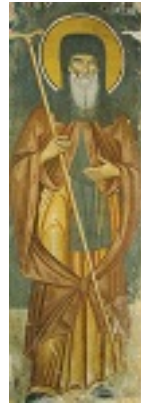
Όσιος Συμεών ηγούμενος Ιεράς μονής Φιλοθέου Αγίου Όρους ο Μονοχίτων και Ανυπόδητος