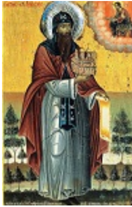
Όσιος Συμεών ηγούμενος Ιεράς μονής Φιλοθέου Αγίου Όρους ο Μονοχίτων και Ανυπόδητος