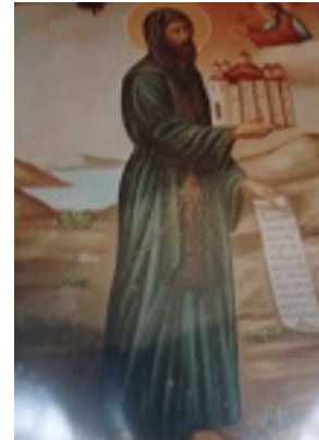
Όσιος Συμεών ηγούμενος Ιεράς μονής Φιλοθέου Αγίου Όρους ο Μονοχίτων και Ανυπόδητος