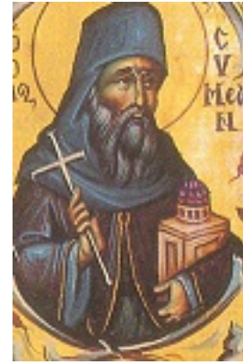
Όσιος Συμεών ηγούμενος Ιεράς μονής Φιλοθέου Αγίου Όρους ο Μονοχίτων και Ανυπόδητος