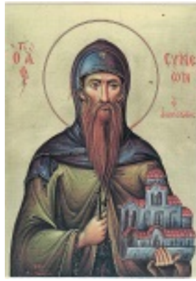
Όσιος Συμεών ηγούμενος Ιεράς μονής Φιλοθέου Αγίου Όρους ο Μονοχίτων και Ανυπόδητος