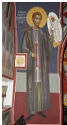
Άγιος Αγαθάγγελος ο Εσφιγμενίτης Άγιος Αγαθάγγελος ο Εσφιγμενίτης