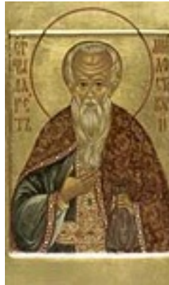
Άγιος Φιλάρετος ο Ελεήμων