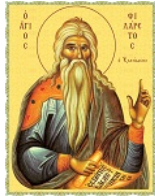
Άγιος Φιλάρετος ο Ελεήμων