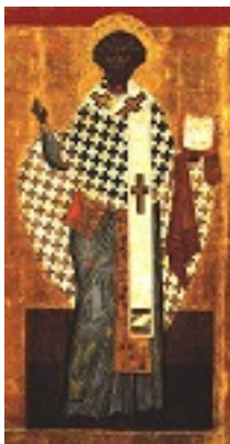
Άγιος Κλήμης Ιερομάρτυρας επίσκοπος Ρώμης