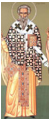
Άγιος Κλήμης Ιερομάρτυρας επίσκοπος Ρώμης