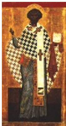
Άγιος Κλήμης Ιερομάρτυρας επίσκοπος Ρώμης