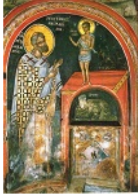
Άγιος Πέτρος Ιερομάρτυρας Αρχιεπίσκοπος Αλεξανδρείας - Ι.Μ. Διονυσίου, Άγιον Όρος