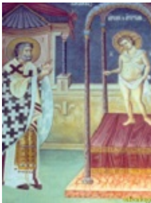
Άγιος Πέτρος Ιερομάρτυρας Αρχιεπίσκοπος Αλεξανδρείας