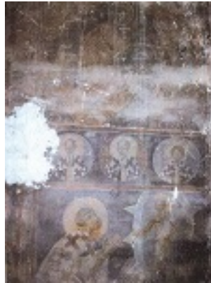
Άγιος Πέτρος Ιερομάρτυρας Αρχιεπίσκοπος Αλεξανδρείας