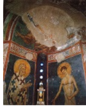
Άγιος Πέτρος Ιερομάρτυρας Αρχιεπίσκοπος Αλεξανδρείας