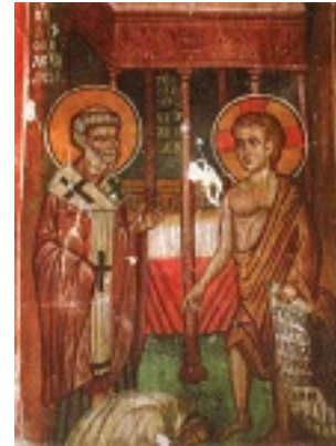
Άγιος Πέτρος Ιερομάρτυρας Αρχιεπίσκοπος Αλεξανδρείας