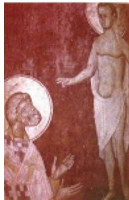
Άγιος Πέτρος Ιερομάρτυρας Αρχιεπίσκοπος Αλεξανδρείας