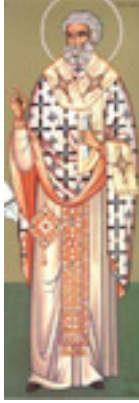
Άγιος Πέτρος Ιερομάρτυρας Αρχιεπίσκοπος Αλεξανδρείας