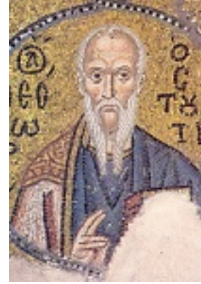
Όσιος Θεόδωρος ο Ομολογητής ηγούμενος Μονής Στουδίου