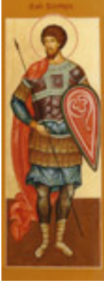
Άγιος Βίκτωρ Μεγαλομάρτυρας