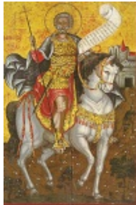
Άγιος Μηνάς «ό έν τῷ Κοτυαείῳ» ο Μεγαλομάρτυρας