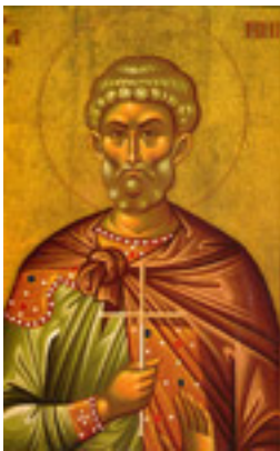
Άγιος Μηνάς «ό έν τῷ Κοτυαείῳ» ο Μεγαλομάρτυρας