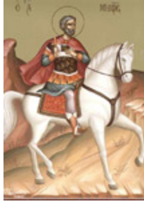
Άγιος Μηνάς «ό έν τῷ Κοτυαείῳ» ο Μεγαλομάρτυρας