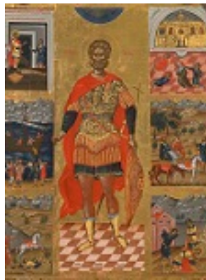
Άγιος Μηνάς «ό έν τῷ Κοτυαείῳ» ο Μεγαλομάρτυρας - Εμμανουήλ Λαμπάρδος, αρχές 17ου αιώνα μ.Χ.