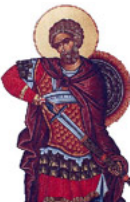
Άγιος Μηνάς «ό έν τῷ Κοτυαείῳ» ο Μεγαλομάρτυρας