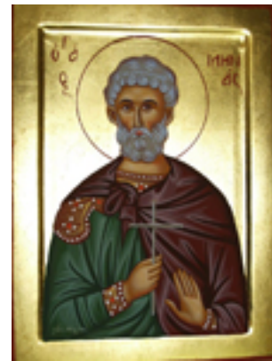
Άγιος Μηνάς «ό έν τῷ Κοτυαείῳ» ο Μεγαλομάρτυρας - Λυδία Γουριώτη© (lydiagourioti- iconography.blogspot.com)