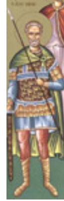
Άγιος Μηνάς «ό έν τῷ Κοτυαείῳ» ο Μεγαλομάρτυρας