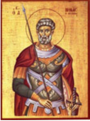
Άγιος Μηνάς «ό έν τῷ Κοτυαείῳ» ο Μεγαλομάρτυρας