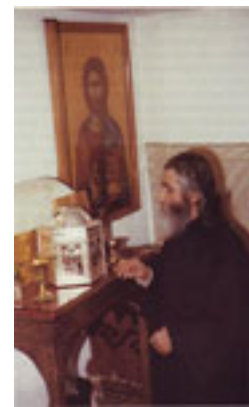
Ο μακαριστός Γέροντας Παΐσιος στο Ησυχαστήριο, στον χώρο όπου φυλάσσονταν τα ιερά Λείψανα του Αγίου Αρσενίου, πριν κτισθεί ο Ναός