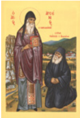
Ο Όσιος Αρσένιος ο Καππαδόκης με τον Γέροντα Παΐσιο