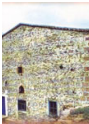
Ο Ι. Ν. Οσιομαρτύρων Βαραχησίου και Ιωνά όπου λειτουργούσε ο Όσιος Αρσένιος ο Καππαδόκης