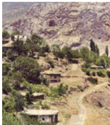
Άποψη του χωριού του Αγίου Αρσενίου στα Φάρασσα. Λαξευτές στο βράχο, οι εκκλησίες της Παναγίας (αριστερά) και του Αγίου Βασιλείου (δεξιά)