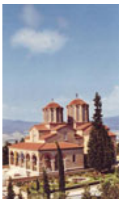
Ο Ι. Ν. του Αγίου Αρσενίου στο Ιερό Ησυχαστήριο «Ευαγγελιστής Ιωάννης ο Θεολόγος» στη Σουρωτή Θεσσαλονίκης