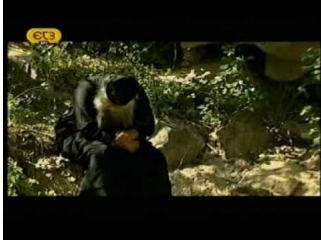
Φάρασα και ο Άγιος Αρσένιος ο Καπλαδόκης