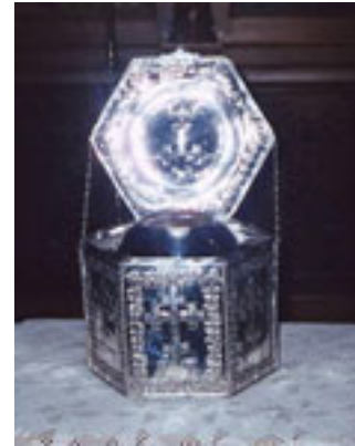
Η τίμια κάρα του Αγίου Αρσενίου του Καππαδόκη, που βρίσκεται στο Ιερό Ησυχαστήριο στη Σουρωτή Θεσσαλονίκης