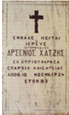
Η πλάκα που τοποθέτησαν στον τάφο του Αγίου Αρσενίου του Καππαδόκη οι Φαρασιώτες