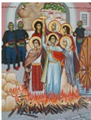
Άγιες Έξι Παρθενομάρτυρες του Γεροπλατάνου Χαλκιδικής