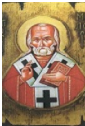
Άγιος Μίλος ο Θαυματουργός Επίσκοπος και Ιερομάρτυρας