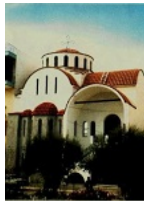
Ιερός Ναός Αγίου Μίλου, Πάτρα