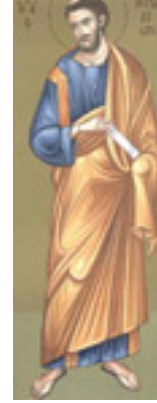
Άγιος Ηρωδίων ο Απόστολος από τους Εβδομήκοντα