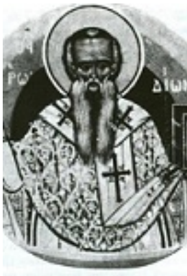
Άγιος Ηρωδίων ο Απόστολος από τους Εβδομήκοντα