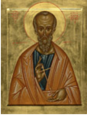
Άγιος Ηρωδίων ο Απόστολος από τους Εβδομήκοντα