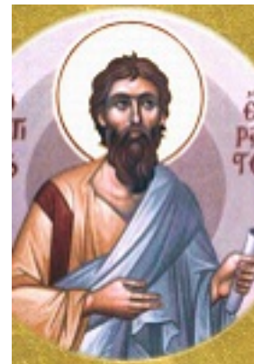
Άγιος Έραστος ο Απόστολος από τους Εβδομήκοντα