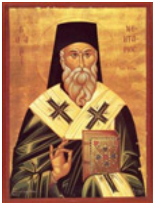
Άγιος Νεκτάριος Μητροπολίτης Πενταπόλεως Αιγύπτου