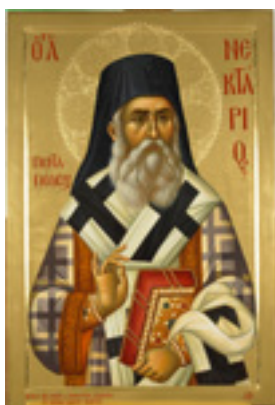
Άγιος Νεκτάριος Μητροπολίτης Πενταπόλεως Αιγύπτου - Εικόνα από το Αγιογραφείο της Μονής Βατοπαιδίου