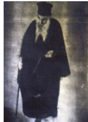
Άγιος Νεκτάριος Μητροπολίτης Πενταπόλεως Αιγύπτου