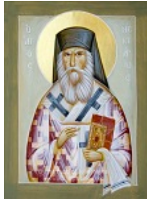
Άγιος Νεκτάριος Μητροπολίτης Πενταπόλεως Αιγύπτου - Julia Hayes© (www.ikonographics.net)