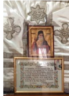
Άγιος Νεκτάριος Μητροπολίτης Πενταπόλεως Αιγύπτου - Ωμοφόριον (εις Γραφείον Πρωτοσυγκέλου Α.Α.)