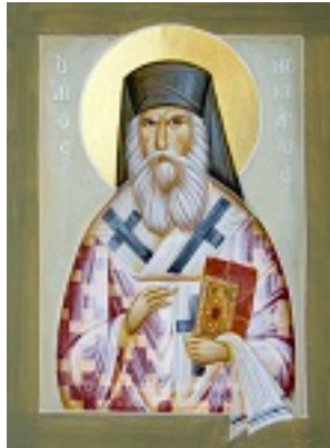
Άγιος Νεκτάριος Μητροπολίτης Πενταπόλεως Αιγύπτου - Julia Hayes© (www.ikonographics.net)