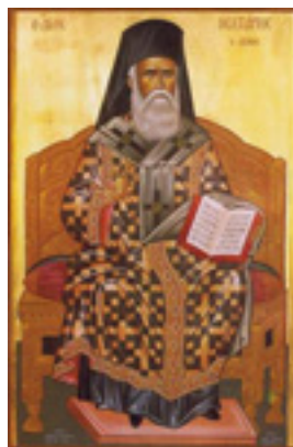
Άγιος Νεκτάριος Μητροπολίτης Πενταπόλεως Αιγύπτου