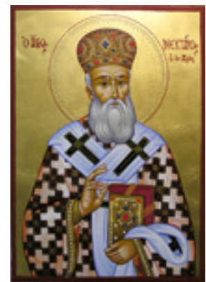
Άγιος Νεκτάριος Μητροπολίτης Πενταπόλεως Αιγύπτου