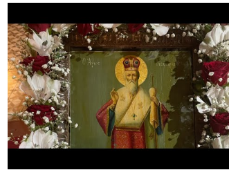
Εγκώμια Αγίου Νεκτάριου ( ζωντανή ηχογράφηση 2/9/22)