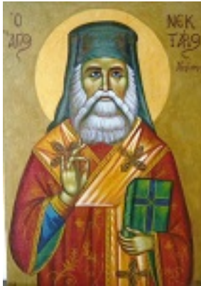
Άγιος Νεκτάριος Μητροπολίτης Πενταπόλεως Αιγύπτου - Ησυχαστήριο «Παναγία των Βρυούλων»