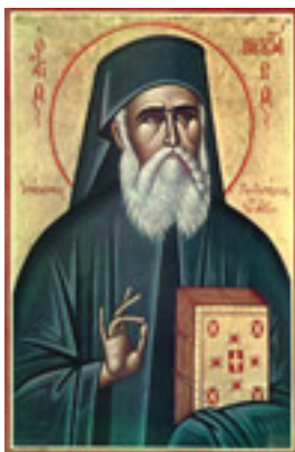
Άγιος Νεκτάριος Μητροπολίτης Πενταπόλεως Αιγύπτου