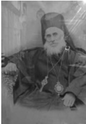
Άγιος Νεκτάριος Μητροπολίτης Πενταπόλεως Αιγύπτου