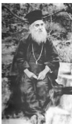
Άγιος Νεκτάριος Μητροπολίτης Πενταπόλεως Αιγύπτου