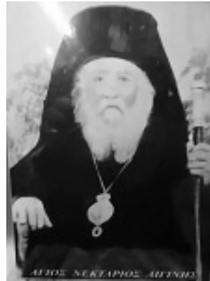
Άγιος Νεκτάριος Μητροπολίτης Πενταπόλεως Αιγύπτου