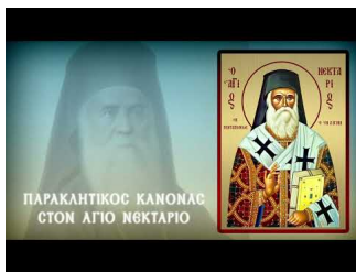
ΠΑΡΑΚΛΗΣΗ ΑΓΙΟΥ ΝΕΚΤΑΡΙΟΥ