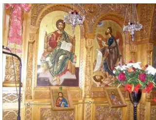
Παράκληση Αγίου Νεκταρίου