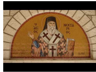
Παρακλητικός Κανών Αγίου Νεκταρίου Επισκόπου Πενταπόλεως του Θαυματουργού