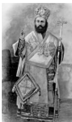
Άγιος Νεκτάριος Μητροπολίτης Πενταπόλεως Αιγύπτου