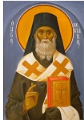
Άγιος Νεκτάριος Μητροπολίτης Πενταπόλεως Αιγύπτου - Ι. Ν. Οσίων Παρθενίου και Ευμενίου των εν Κουδουμά, δια χειρός Παναγιώτη Μόσχου (2006 μ.Χ.)