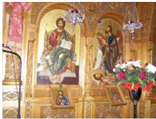
Παράκληση Αγίου Νεκταρίου