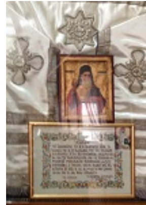
Άγιος Νεκτάριος Μητροπολίτης Πενταπόλεως Αιγύπτου - Ωμοφόριον (εις Γραφείον Πρωτοσυγκέλου Α.Α.)