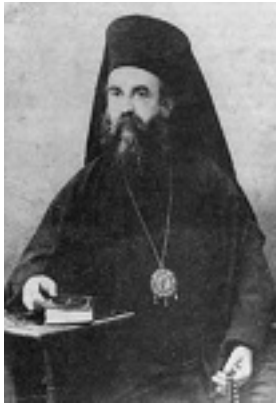
Άγιος Νεκτάριος Μητροπολίτης Πενταπόλεως Αιγύπτου