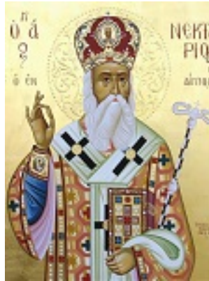
Άγιος Νεκτάριος Μητροπολίτης Πενταπόλεως Αιγύπτου