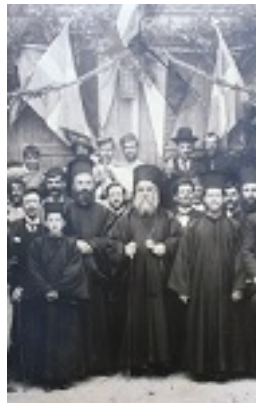
Άγιος Νεκτάριος Μητροπολίτης Πενταπόλεως Αιγύπτου - Κύμη, 1893 μ.Χ.