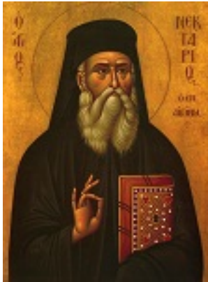
Άγιος Νεκτάριος Μητροπολίτης Πενταπόλεως Αιγύπτου