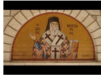
Παρακλητικός Κανών Αγίου Νεκταρίου Επισκόπου Πενταπόλεως του Θαυματουργού