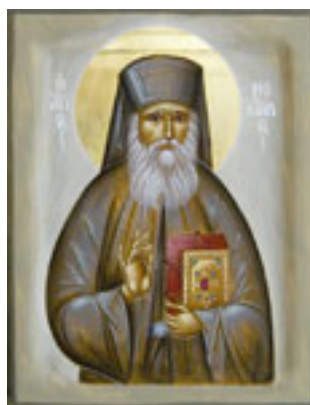
Άγιος Νεκτάριος Μητροπολίτης Πενταπόλεως Αιγύπτου