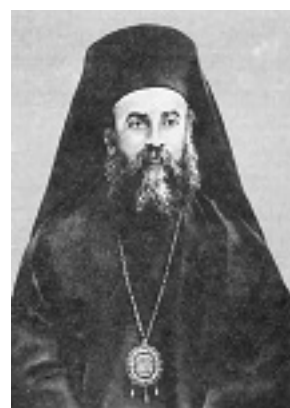
Άγιος Νεκτάριος Μητροπολίτης Πενταπόλεως Αιγύπτου