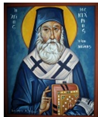
Άγιος Νεκτάριος Μητροπολίτης Πενταπόλεως Αιγύπτου - Αγγελική Τσέλιου © (diaxeirosaggelikistseliou. blogspot.com)