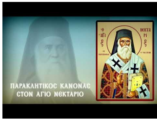
ΠΑΡΑΚΛΗΣΗ ΑΓΙΟΥ ΝΕΚΤΑΡΙΟΥ