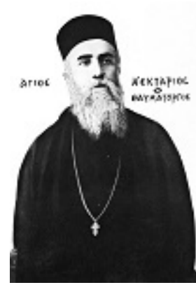
Άγιος Νεκτάριος Μητροπολίτης Πενταπόλεως Αιγύπτου