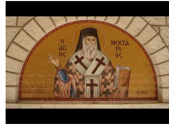
Παρακλητικός Κανών Αγίου Νεκταρίου Επισκόπου Πενταπόλεως του Θαυματουργού