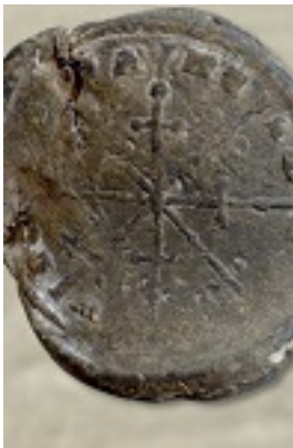
Όσιος Συμεών ο Μεταφραστής - Μολυβδόβουλλο του Οσίου Συμεώνος Μεταφραστού