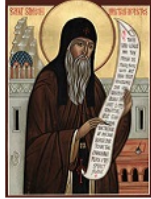
Όσιος Συμεών ο Μεταφραστής