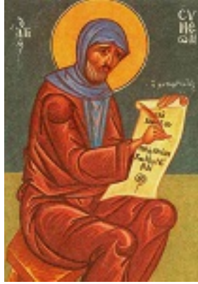
Όσιος Συμεών ο Μεταφραστής