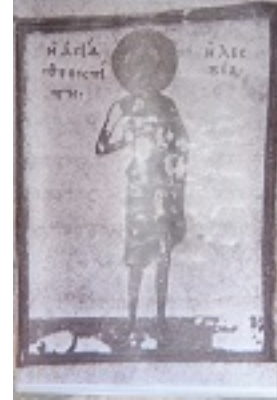
Οσία Θεοκτίστη η Λέσβια - Παροικιά Πάρου