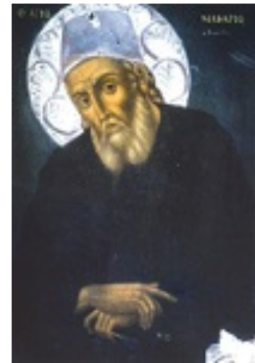
Φορητή εικόνα του Αγίου Μακαρίου του Νοταρά στο καθολικό της Ιεράς Μονής Προφήτου Ηλίου Ύδρας