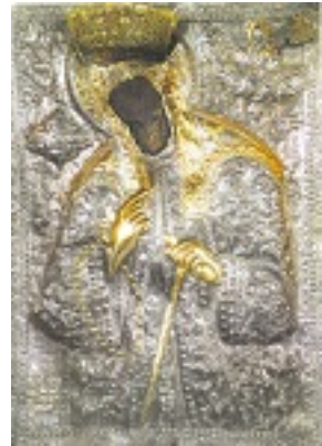
Το θαυμάσιο ασημένιο πουκάμισο της εφέστιας εικόνας του Αγίου Μακαρίου στους Μύλους Σάμου. Χρονολογείται από το 1822, γεγονός που συγκρατάει την εικόνα ως μία από τις παλαιότερες που ιστορήθηκαν προς τιμήν του θαυματουργού Αγίου