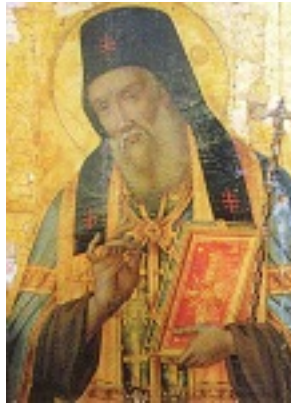
Η αριστουργηματική εφέστια εικόνα του Αγίου Μακαρίου του Νοταρά Αρχιεπισκόπου Κορίνθου στο ομώνυμο παρεκκλήσιο της Ιεράς Μονής Ευαγγελισμού Θεοτόκου Λευκάδος Ικαρίας