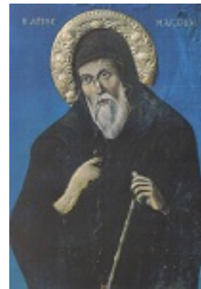
Φορητή εικόνα του Αγίου Μακαρίου του Νοταρά στον ομώνυμο Ιερό Ναό των Μύλων Σάμου