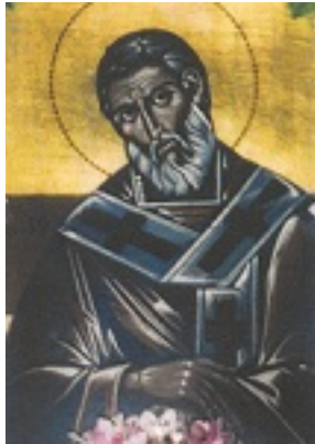
Φορητή εικόνα του Αγίου Μακαρίου από το τέμπλο του παλαιού ναού