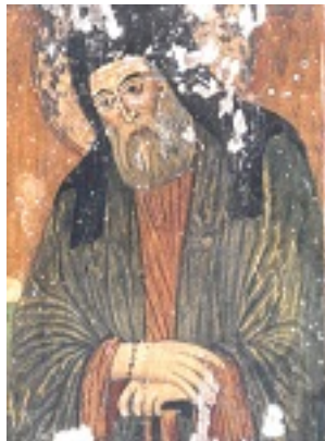
Άγιος Μακάριος Αρχιεπίσκοπος Κορίνθου, ο Νοταράς