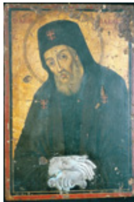
Άγιος Μακάριος Αρχιεπίσκοπος Κορίνθου, ο Νοταράς