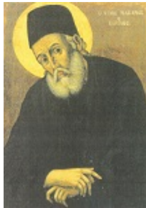
Φορητή εικόνα του Αγίου Μακαρίου του Νοταρά Αρχιεπισκόπου Κορίνθου στην Ιερά Μονή Προφήτου Ηλίου Ύδρας