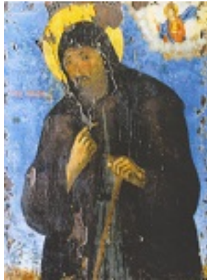
Η εφέστια θαυματουργή εικόνα του Αγίου Μακαρίου στο χωριό Μύλοι Σάμου. Φυλάσσεται στον Ιερό Ενοριακό Ναό Αγίου Χαραλάμπους Μύλων και λιτανεύεται στις 16 Μαΐου, ημέρα του πανηγυρικού εορτασμού της μνήμης του Αγίου Μακαρίου στους Μύλους Σάμου