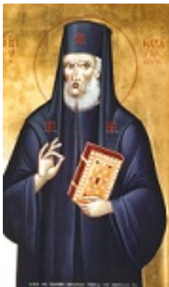
Φορητή εικόνα του Αγίου Μακαρίου δια χειρός Βλασίου Τσοτσώνη. Κοσμήι το κεντρικό προσκυνητάριο του ενοριακού ναού του Αγίου Μακαρίου Ξυλοκάστρου Κορινθίας