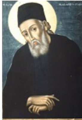
Η αριστουργηματική εφέστια εικόνα του Αγίου Μακαρίου του Νοταρά Αρχιεπισκόπου Κορίνθου στο ομώνυμο παρεκκλήσιο της Ιεράς Μονής Προφήτου Ηλίου Ύδρας