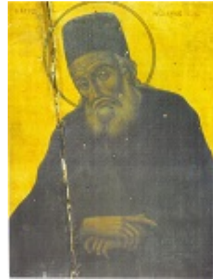
Παλαιά φορητή εικόνα του Αγίου Μακαρίου του Νοταρά Αρχιεπισκόπου Κορίνθου. Φυλάσσεται στον ανεγερθέντα το 1751 μ.Χ. Ιερό Ναό Ευαγγελιστρίας του Μπενάκη πόλεως Ύδρας