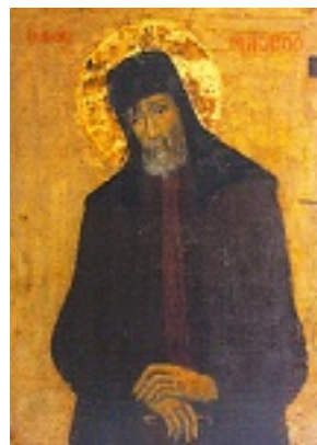
Φορητή εικόνα του Αγίου Μακαρίου λαϊκής τεχντροπίας