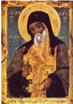
Άγιος Μακάριος Αρχιεπίσκοπος Κορίνθου, ο Νοταράς