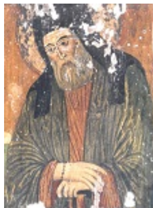
Άγιος Μακάριος Αρχιεπίσκοπος Κορίνθου, ο Νοταράς