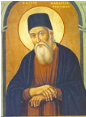
Φορητή εικόνα του Αγίου Μακαρίου του Νοταρά στην Ιερά Μονή Γενεσίου Θεοτόκου Ζούρβας Ύδρας