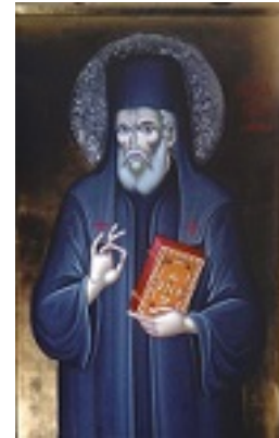
Φορητή εικόνα του Αγίου Μακαρίου δια χειρός Βλασίου Τσοτσώνη στο τέμπλο του ενοριακού ναού του Αγίου Μακαρίου Ξυλοκάστρου Κορινθίας