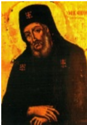
Παλαιά φορητή εικόνα του Αγίου Μακαρίου από την Ιερά Μονή Οσίου Παταπίου Λουτρακίου Κορινθίας