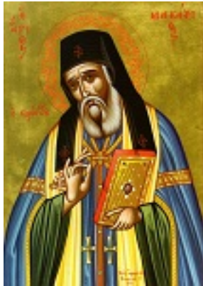
Άγιος Μακάριος Αρχιεπίσκοπος Κορίνθου, ο Νοταράς