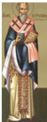
Άγιος Κύριλλος<br />Αρχιεπίσκοπος Ιεροσολύμων