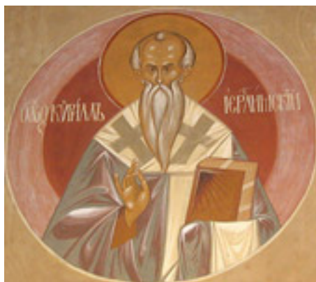
Άγιος Κύριλλος<br />Αρχιεπίσκοπος Ιεροσολύμων